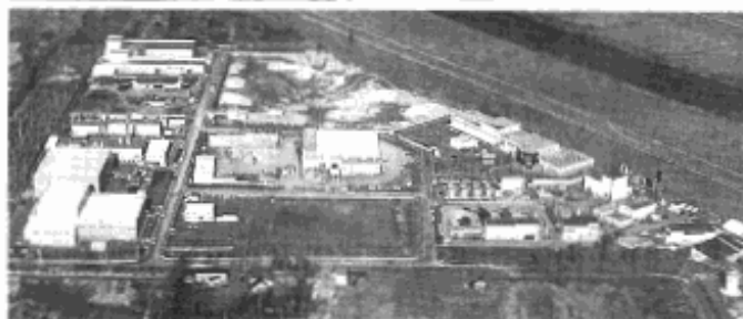
◆札幌市リサイクル団地を視察 (7月13日)

今までは埋め立て処分されてきた、建設工事に伴い発生する混合廃棄物を選別・破砕により減容・リサイクルする中間処理施設